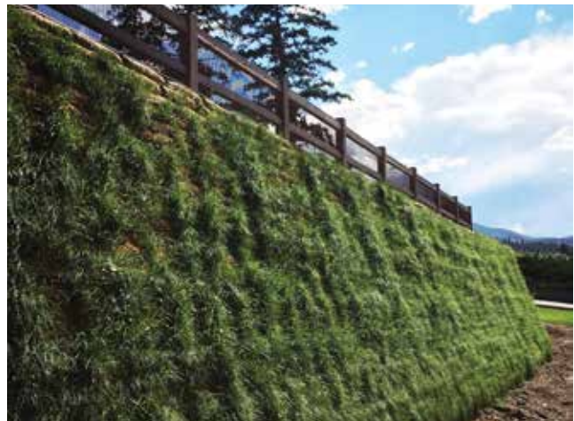
Mur de soutènement paysager de 5 m (16 pi) de hauteur

Le système végétalisé mural Flex MSE fournit la force des éléments imbriqués sans besoin de béton, de barre d'armature, treillis métallique ou autres coffrages.