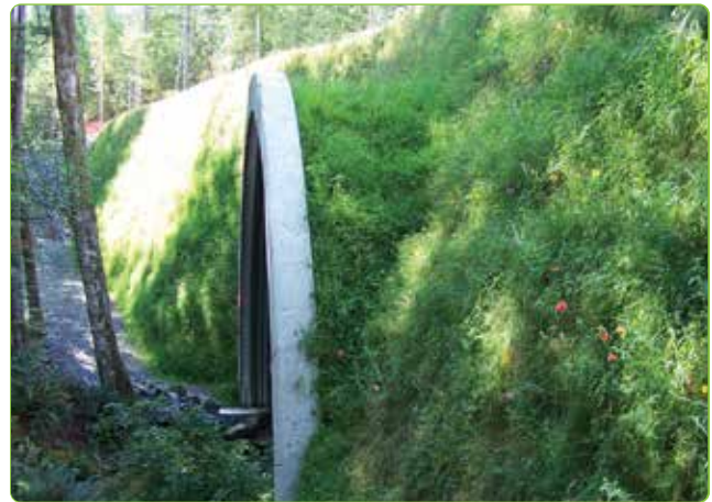
Chaussée municipale de 10m (33 pi) de haut